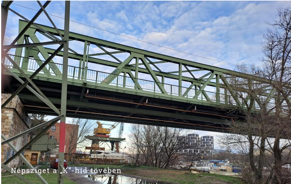
Népsziget a „K”-híd tövében