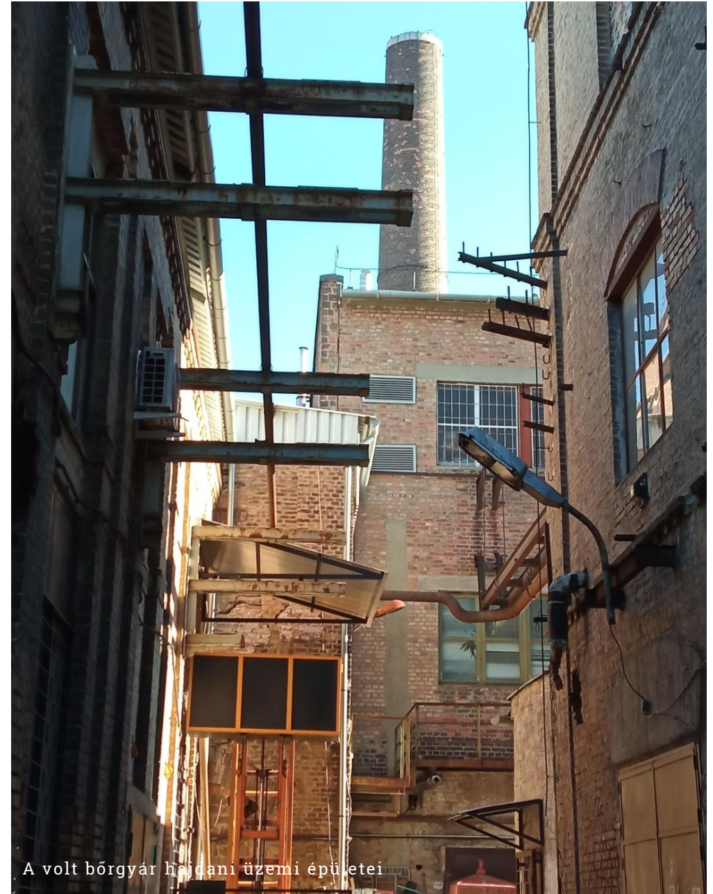
A volt bőrgyár hajdani üzemi épületei