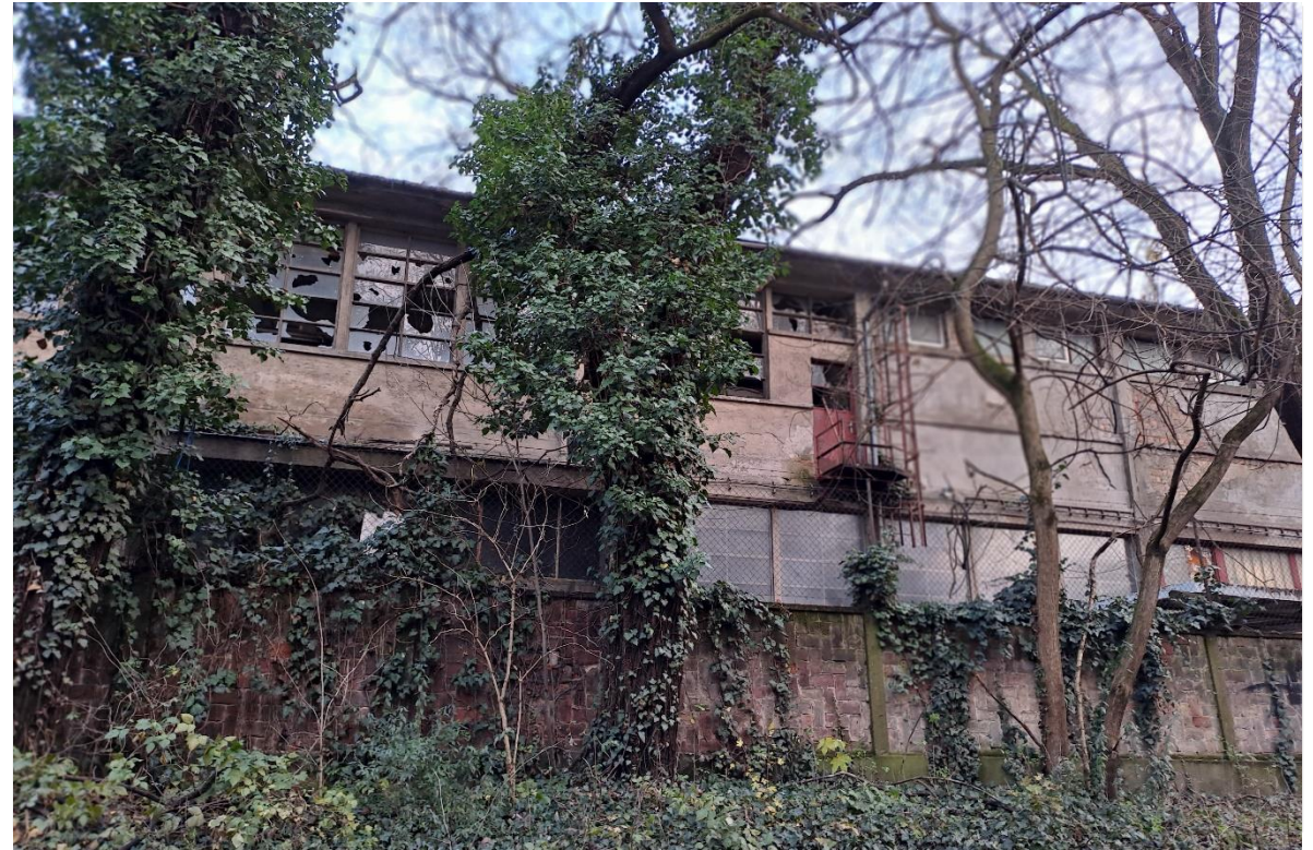
Romos hajógyári épületek a Népszigeten

A Téli Kikötő és a Váci út mellett, a Dunához vezető leendő gyalogos útvonal menti, átalakulásra váró két volt ipari tömb kiváló közlekedési, tömegközlekedési elérhetőséggel, folyóöböl melletti közvetlen vízkapcsolattal rendelkezik. A természet és a sűrű, dinamikus városi közeg közti határterület: két oldalán a „döngő” Váci úti forgalom és egy csendes, zárt világ, ahonnan a Népsziget és a Nagy-Duna partja közvetlenül elérhető. A területen lévő hajdani ipari épületek részben megtarthatók; funkcióváltásuk, a köztük lévő üres vagy bontásokkal felszabaduló területekhez való téri viszonyuk a feladat egyik legizgalmasabb része.