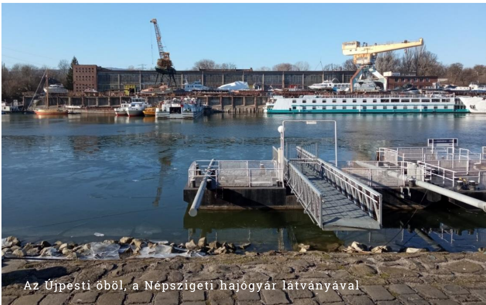
Az Újpesti öböl, a Népszigeti hajógyár látványával