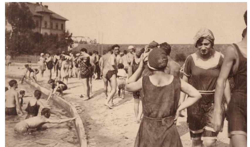
Rákos-patak vizével működő egykori Kristály strand