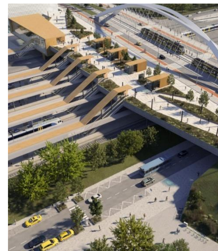
Rákosrendező jövője és jelene