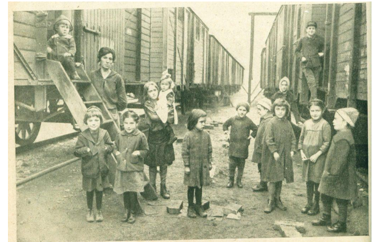
Vagonlakók 1922