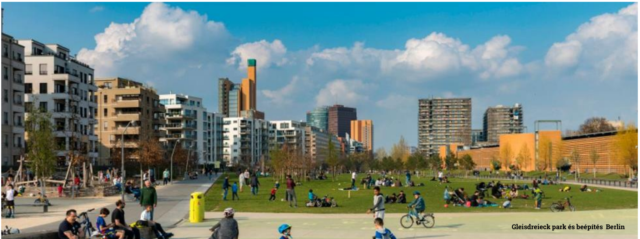
Gleisdreieck park és beépítés Berlin