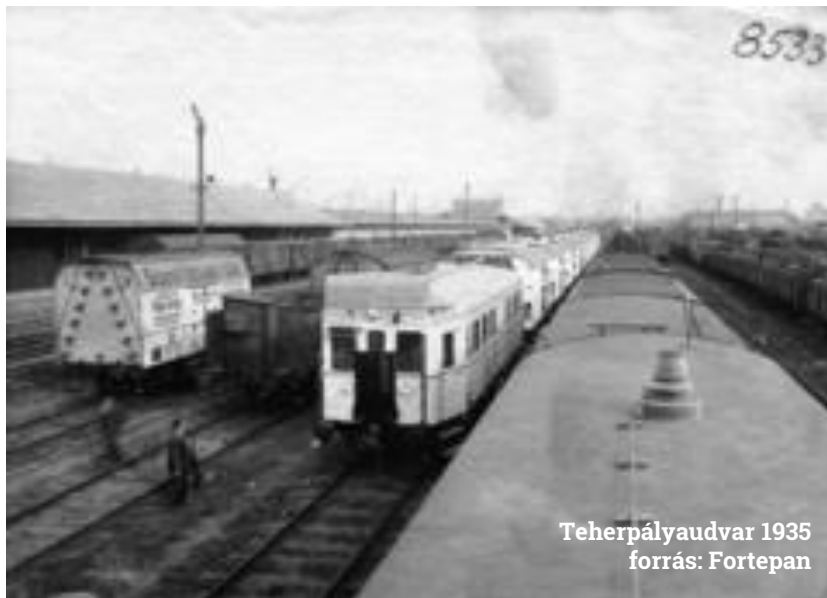
Teherpályaudvar 1935