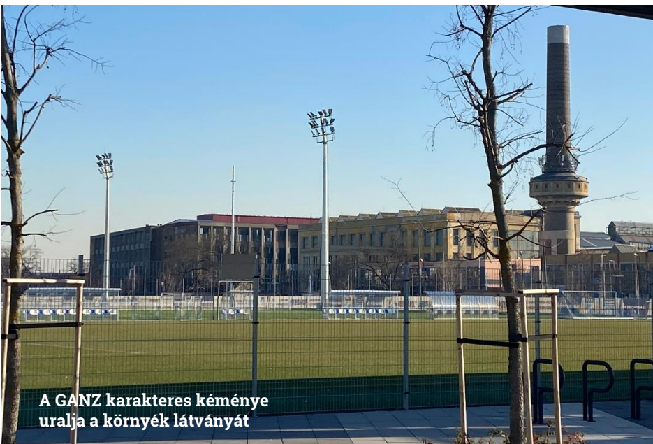
A GANZ karakteres kéménye uralja a környék látványát