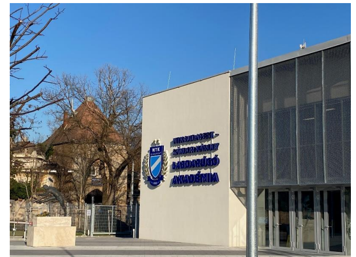
Átmeneti hasznosítás: fociakadémia