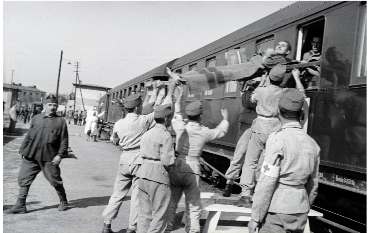
A Vöröskereszt kórházvonata 1942

A Józsefváros pályaudvart 1867-ben nyitották, évtizedeken át a vasúti teherszállítás egyik gócpontja volt, számtalan párhuzamos vágánnyal, kisebb raktárépületekkel, rakodóterületekkel. A történelem folyamán nem csak áruszállításra használták, történelmi katasztrófák emlékezete is kapcsolódik hozzá: innen vitték a világháborúk közkatonáit a frontra, ide érkeztek a vöröskeresztes vonatok a sebesültekkel, itt éltek évekig tehervagonokban Trianon menekültjei és innen vitték a gázkamrákba a magyar zsidóságot. Az 1990-es években a budapesti ipar összeomlásával jelentősen csökkent a teherforgalom, a pályaudvart 2005-ben zárták be végleg.