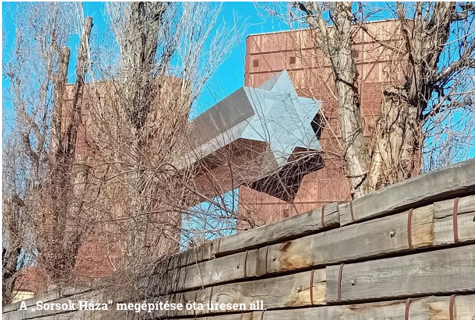
A „Sorsok Háza” megépítése óta üresen áll.