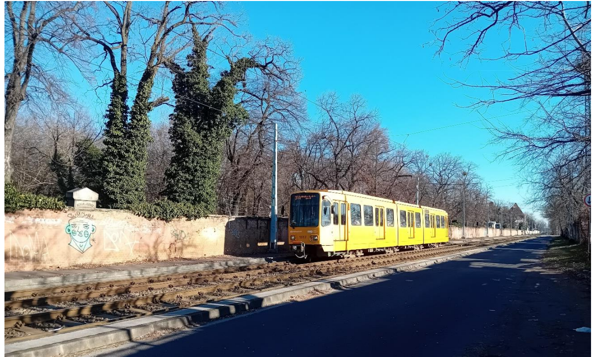
A 37-es villamos bevisz a Blaha Lujza térre

A félév második felében a koncepcióból egy kisebb rész beépítését fogjátok kidolgozni. Ebben a részben nagyobb hangsúlyt kapnak az épületek közötti szabad terek, az épületek tömegei, funkciói, különösen a földszintek kialakítása, építészeti formálása.