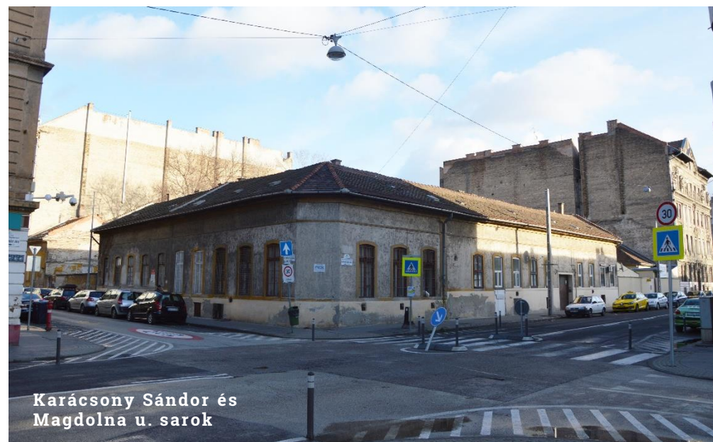
Karácsony Sándor és Magdolna u. sarok