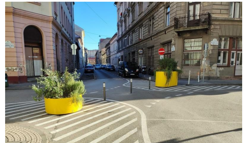
Forgalomcsillapítás - LINK