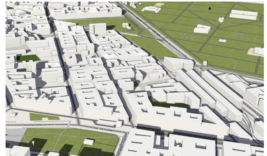
A terület egyszerűsített 3d modellje - LINK