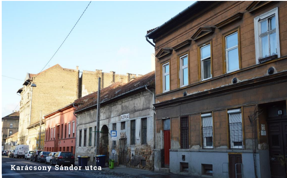
Karácsony Sándor utca