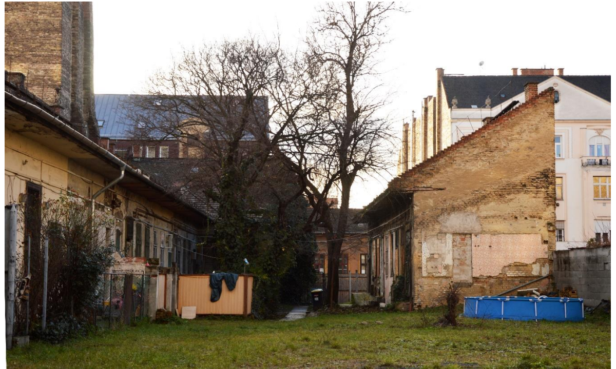
Tömbbelső a Dobozi utcában