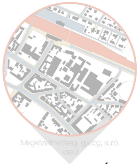
Megközelíthetőség: gyalog, autó, vasút