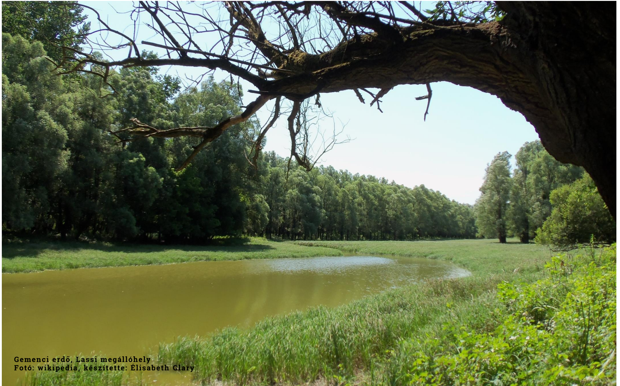
Gemenci erdő, Lassi megállóhely