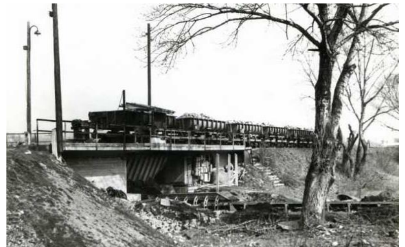
Az átrakodó az 1950-es években