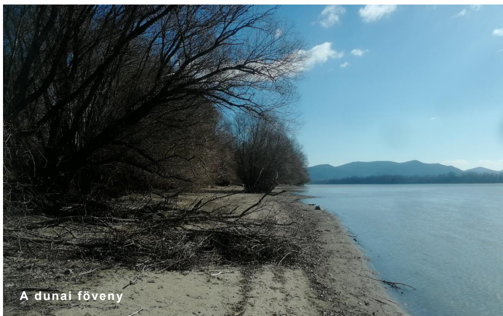
A dunai főveny