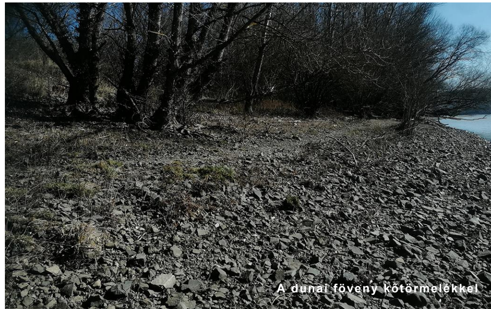
A dunai főveny kötőmelékkel