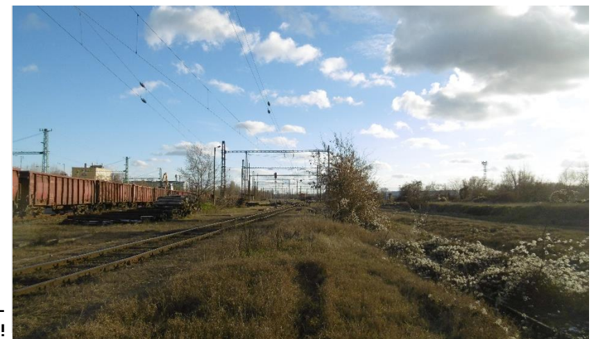
A rendezőpályaudvar- megszűnik!