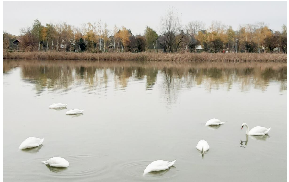
Hattyúk a Ráckevei-Dunán. Háttérben a Molnár-sziget lakóházai.

https://www.turistamagazin.hu/blog-bejegyzes-1/budapest-egyik-legszebb-duna-parti-setanya