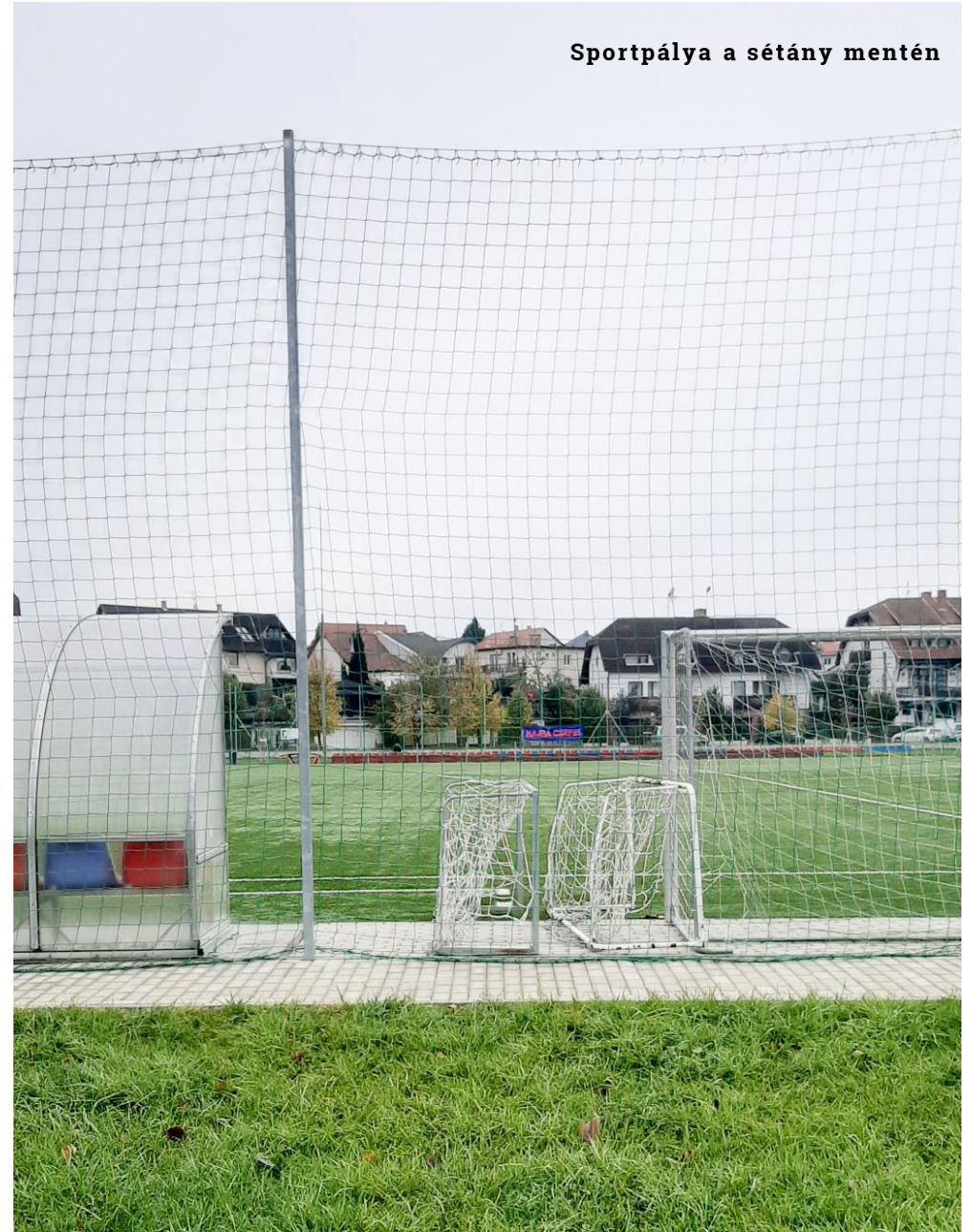
Sportpálya a sétány mentén