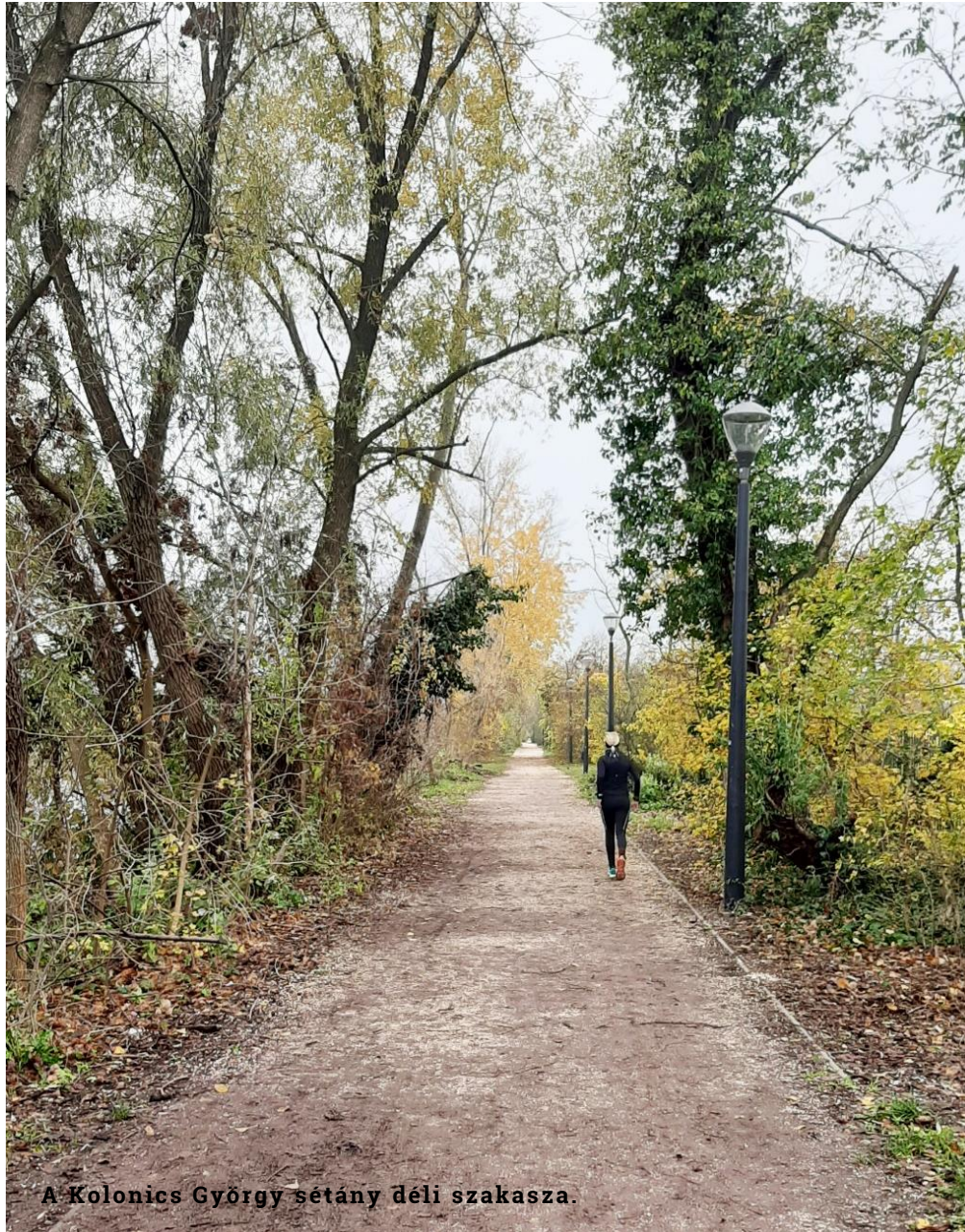
A Kolonics György sétány déli szakasza.