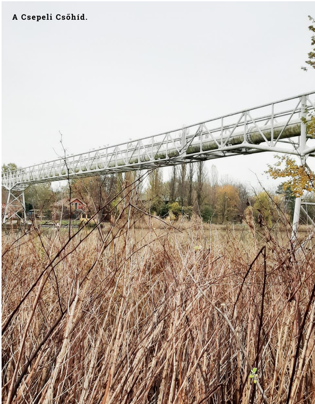
A Csepeli Csőhíd.