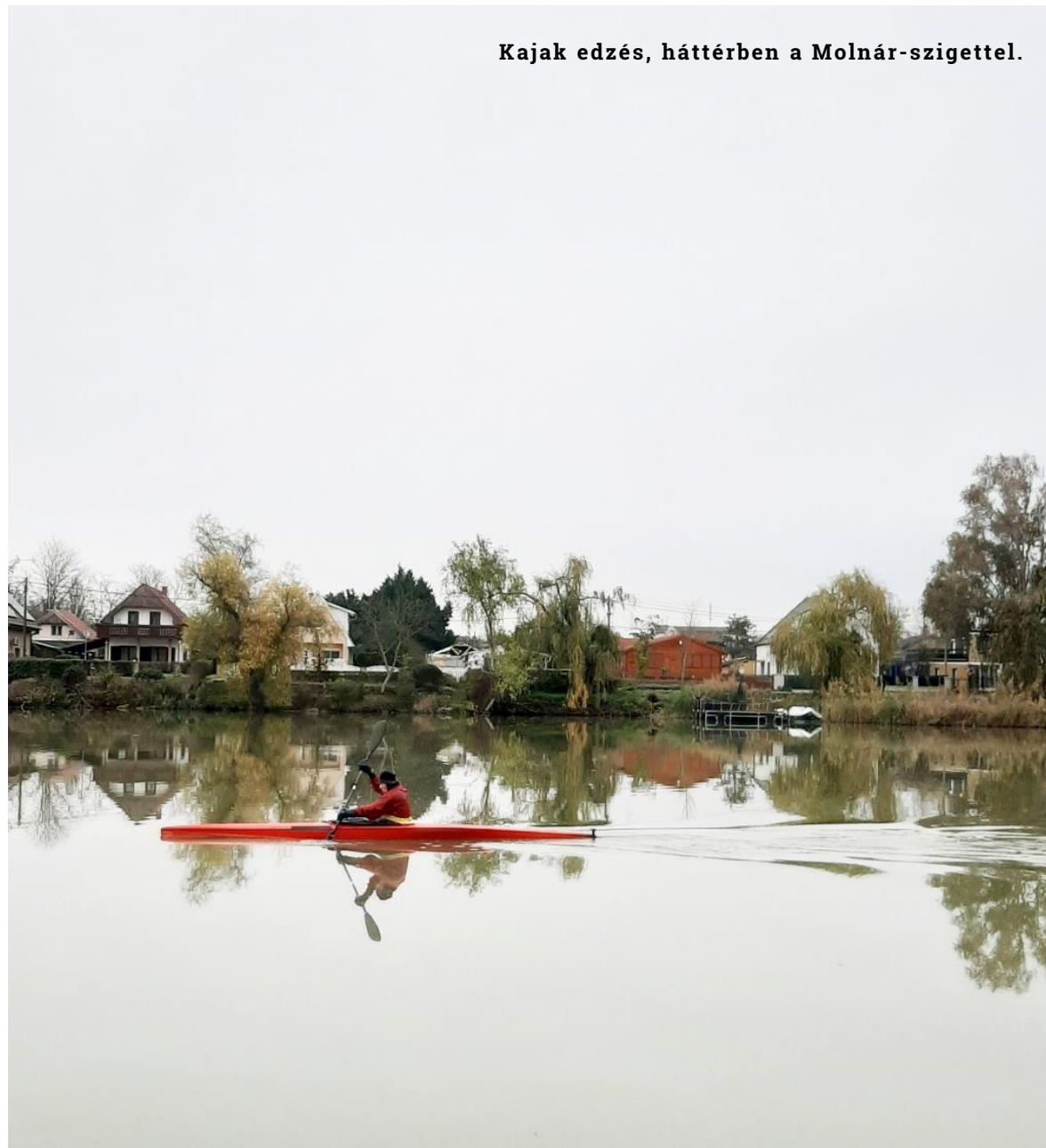
Kajak edzés, háttérben a Molnár-szigettel.

A sétány nyugati – város felőli – oldalán azonban a meglévő turisztikai, szabadidős és sport funkciók mellett felhagyott és alulhasznosított telkek is sorakoznak, miközben Csepel közel 77.000 fős lakossága számára ez az elsőszámú terület, amely a szabadidő eltöltését szolgálja.