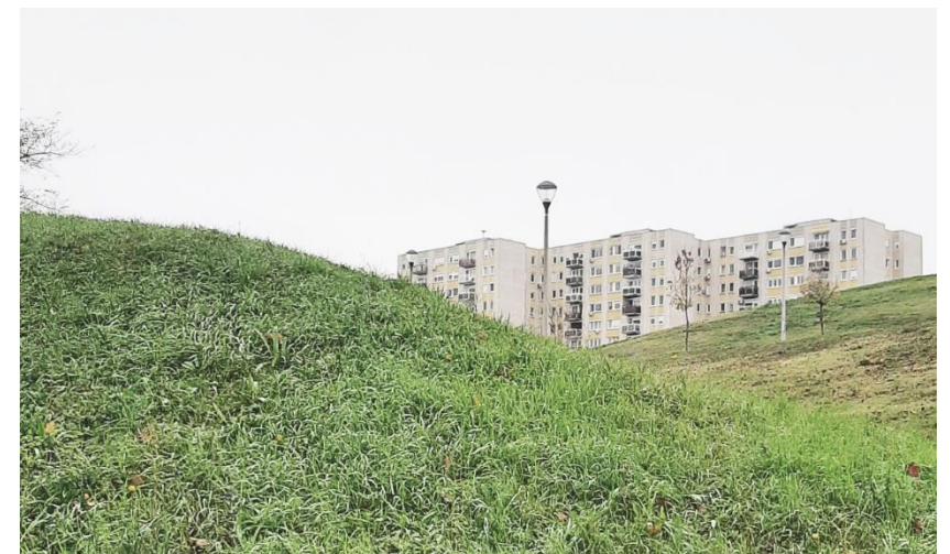
Csepeli panelházak a Darudomb mögött.