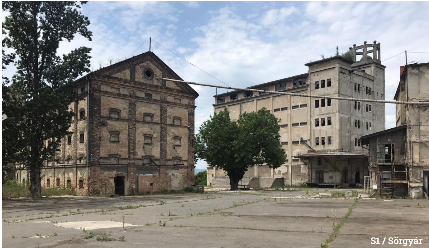
S1 / Sörgyár

Kőbánya külső szemlélő számára nem kifejezetten vonzó hely. Vasúti hálózattal leválasztott zárványkerület, ami sokkal inkább működik a mai napig önálló városként, mint Budapest egy kerületéként. A hírével ellentétben – és ez tényleg érdekes – az ott élők számára kedvelt, otthonos városrész, fasoros utcákkal, villanegyeddal és a szecesszió világörökségi várományos remekműveivel. Kőbánya külső és belső megítélése látványosan különbözik. Olyan, mintha nem lenne fenn a térképen és csak azok tudnák értékelni, akik valóban ismerik?