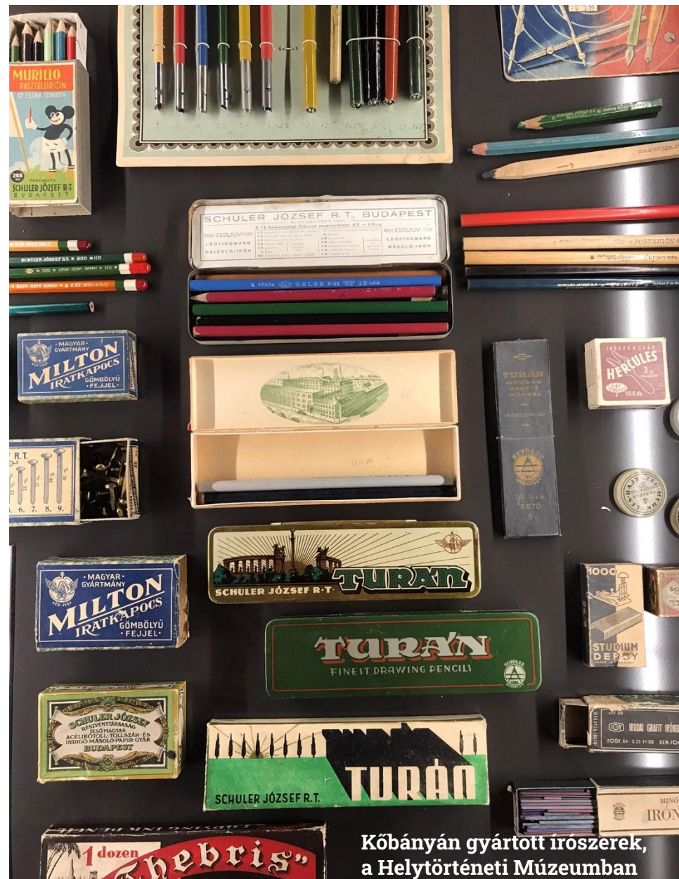
Kőbányán gyártott írószerek, a Helytörténeti Múzeumban

Jelentkezési szándékotokat, kérjük, jelezzétek regisztrációval .