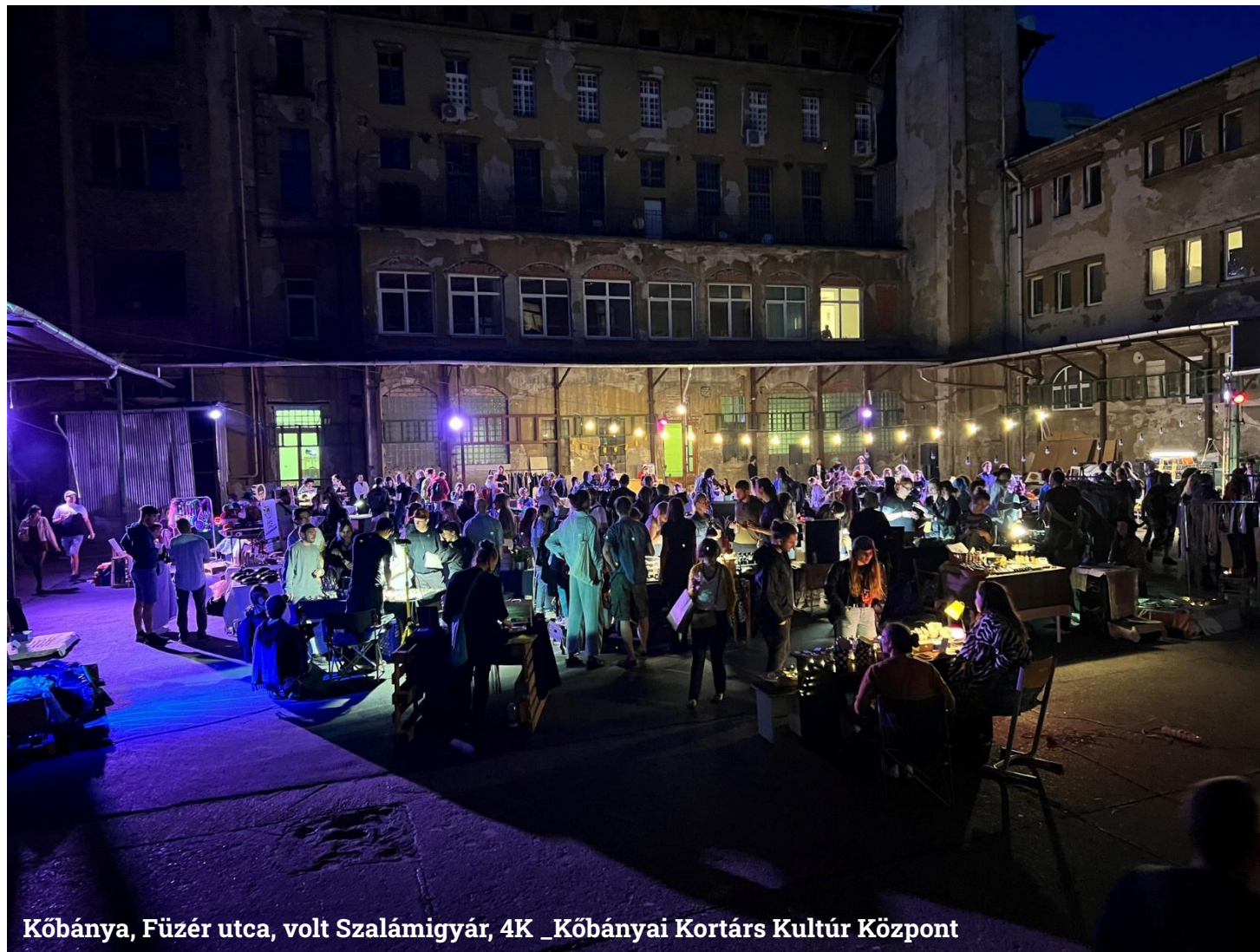
Kőbánya, Füzér utca, volt Szalámigyár, 4K _Kőbányai Kortárs Kultúr Központ