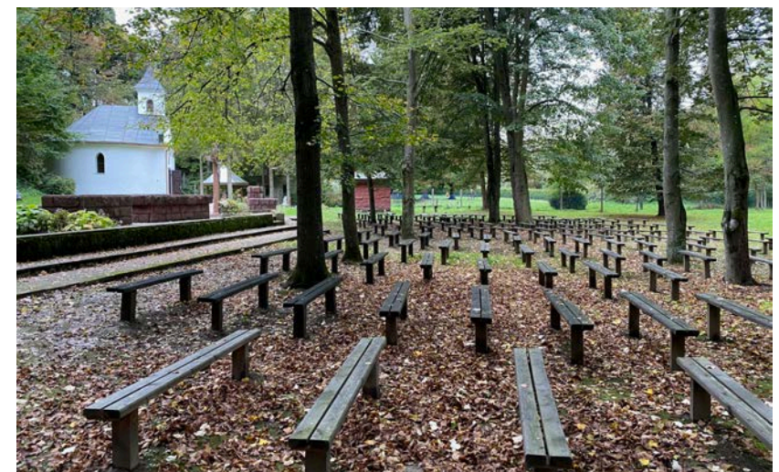
Jásd - szabadtéri miséző hely