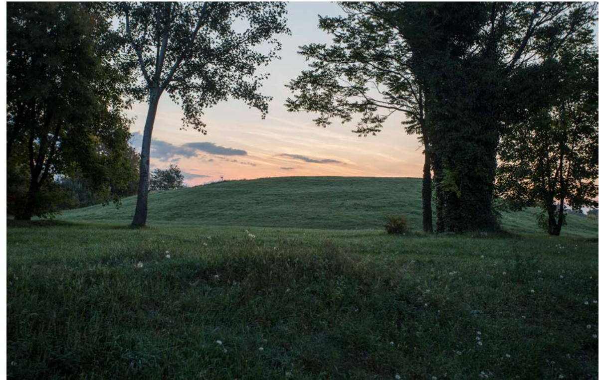
hajnal a Bakonyban

A járványhelyzet új lendületet adott a természetjárásnak. A várostól kényszerűen eltávolodva sokan tapasztalták meg újra a tágabb értelemben vett táji környezetet. Az emberek visszatértek olyan helyekre is melyeket mindig is magukban hordoztak, de talán már régen nem láttak. Néha ez nem is konkrét helyet jelent, csak egy tisztásra érkezést, párák ködbe vesző dombokat, a nap vastag fénycsóváit a fák között, vagy hatalmas lapos sziklákat egy patak vájta szurdokban. A táj rendszerint heterogén, de benne járva mégis vannak olyan karakteres helyek, amiket az ember megjegyez. Ezek fontos részét képezik minden útnak mert ezeket az egyénileg választott hangsúlyokat követve lehet csak visszatérni.