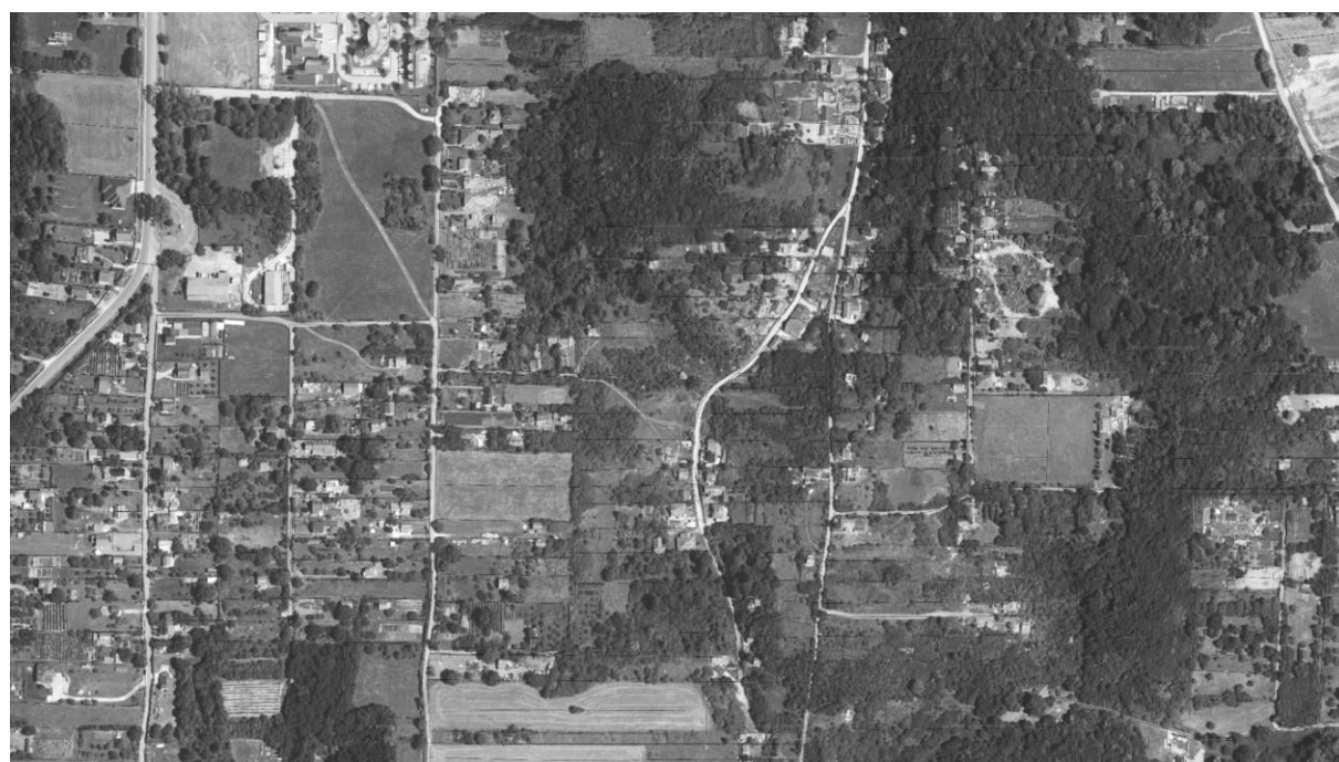
A felülnézetben látszanak a kitaposott utak, amelyek keresztbe-kasul szelik át a fizikai határok nélkül álló telkeket.