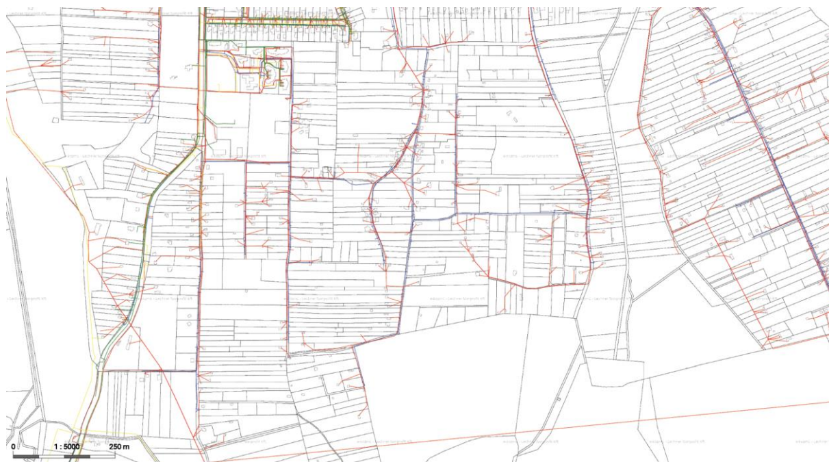
A dűlő közműellátottsága

A terület domborzati viszonyai is nehezítik a közlekedést. A Körte utca és a Cseresznye utca körülbelül 10 méterrel fekszik magasabban, mint a közrefogott árokban kanyargó Barack utca.