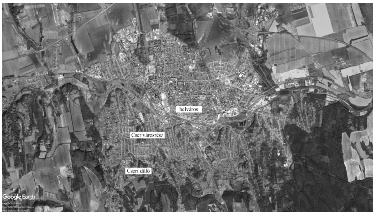
Áttekintő térkép - a városhoz viszonyított helyzet

Kaposvár nem tartozik mélyszegénység által sújtott települések közé. 31 Két szegregátum található a városban. A Pécsi utca és környéki területen koncentráltabb szegénység megsegítésére a Máltai Szeretetszolgálat települt be az elmúlt években, a Cseri dűlő kevésbé feltűnő és szembeötlő szegény területének felkarolására még nem alakult ki gyakorlat. A közelbe telepedett művelődési ház, amely a Cser városrész (Cseri dűlőtől északra, Kaposvár felé) rossz anyagi helyzetben tengődő lakosainak életét kívánja javítani, azonban a Cseri dűlőtől - peremhelyzetéből adódóan - nagy távolságra van.