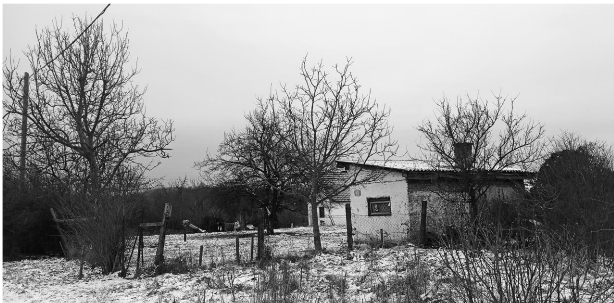
Körte utcai lakóház. Lakóinak száma: ismeretlen.

A térbeliség szerepe a mélyszegénységben élő családok problémáinak megértésében és a segítségnyújtás módjában