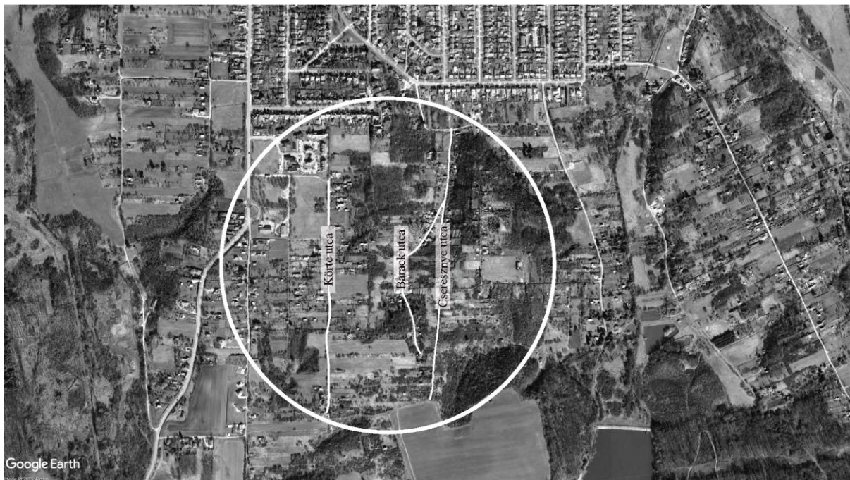
A Cseri dűlő fókuszterülete a három utca, ahol a legnagyobb szegénység koncentrálódik: Körte utca, Barack utca és Cseresznye utca

és a villanyt is bevezetik. A terület takaros képet mutatott. Azonban ahogy az első beköltöző generáció megöregedett, a következő nemzedéknek már nem volt igénye ilyesfajta termeléshez, a dűlő sok telkét eladták, azok elértéktelenedtek. Jelenleg a faluról beköltöző szegény, többségében roma lakosságnak ad otthont, akiknek a panellakás sem megfizethető opció. 32