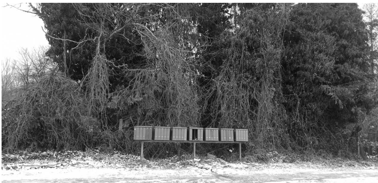
Az út menti postaládák a dűlő kezdetét jelzik..