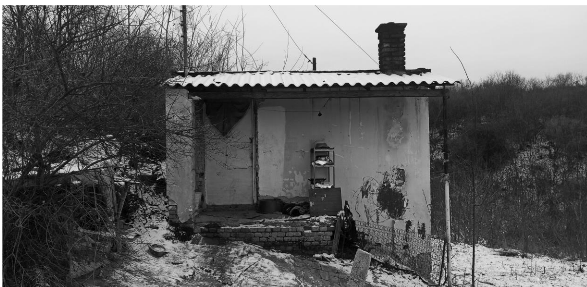
Körte utca végi lakóház. Jelenlegi lakója: egy felnőtt férfi. Korábbi lakóinak száma: 5 fő.