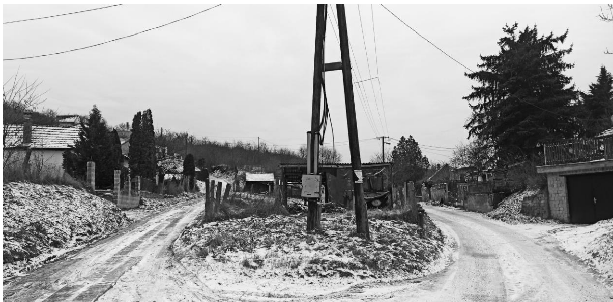
Cseresznye utca - Barack utca elágazása.

A térbeliség szerepe a mélyszegénységben élő családok problémáinak megértésében és a segítségnyújtás módjában