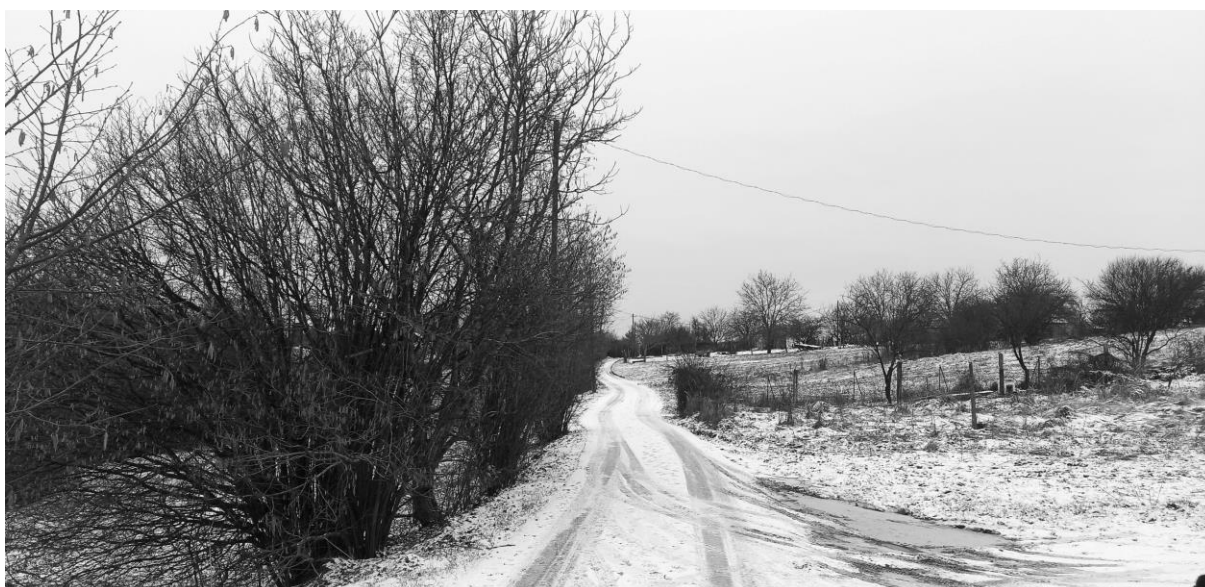
Körte utca kanyarog a város felé.