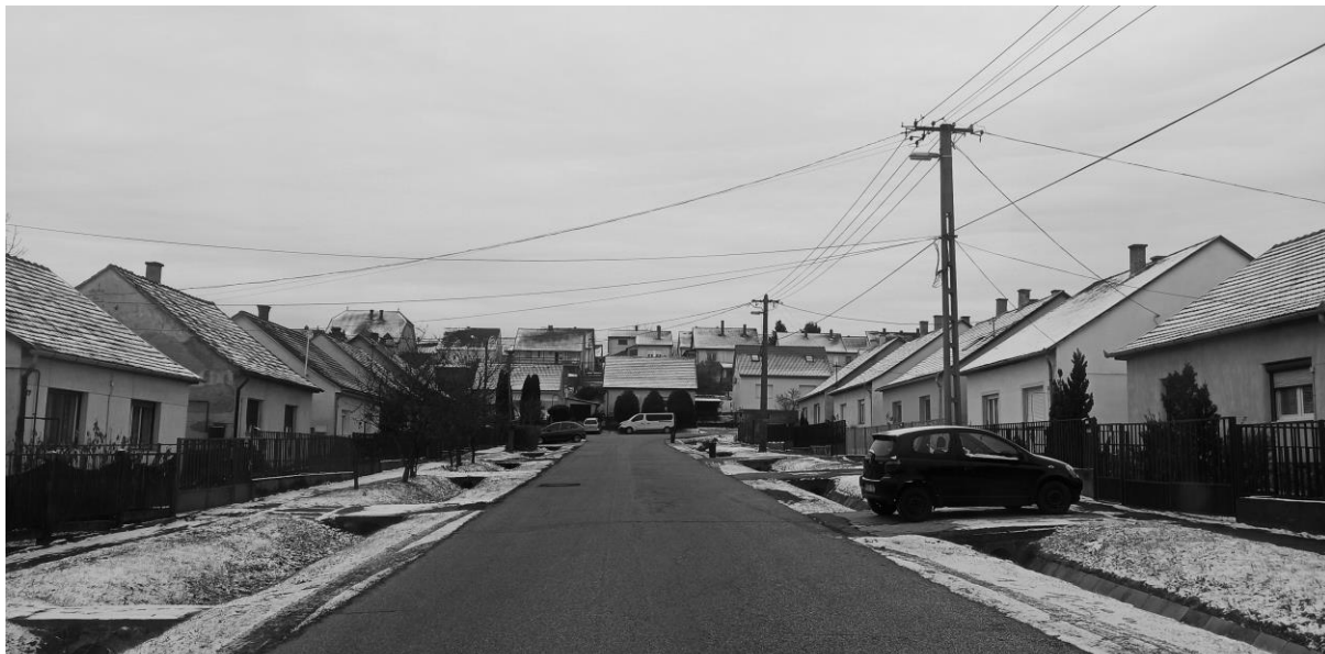
Városkép néhány száz méterre a Cseri dűlőtől (Cser városrész).

A térbeliség szerepe a mélyszegénységben élő családok problémáinak megértésében és a segítségnyújtás módjában