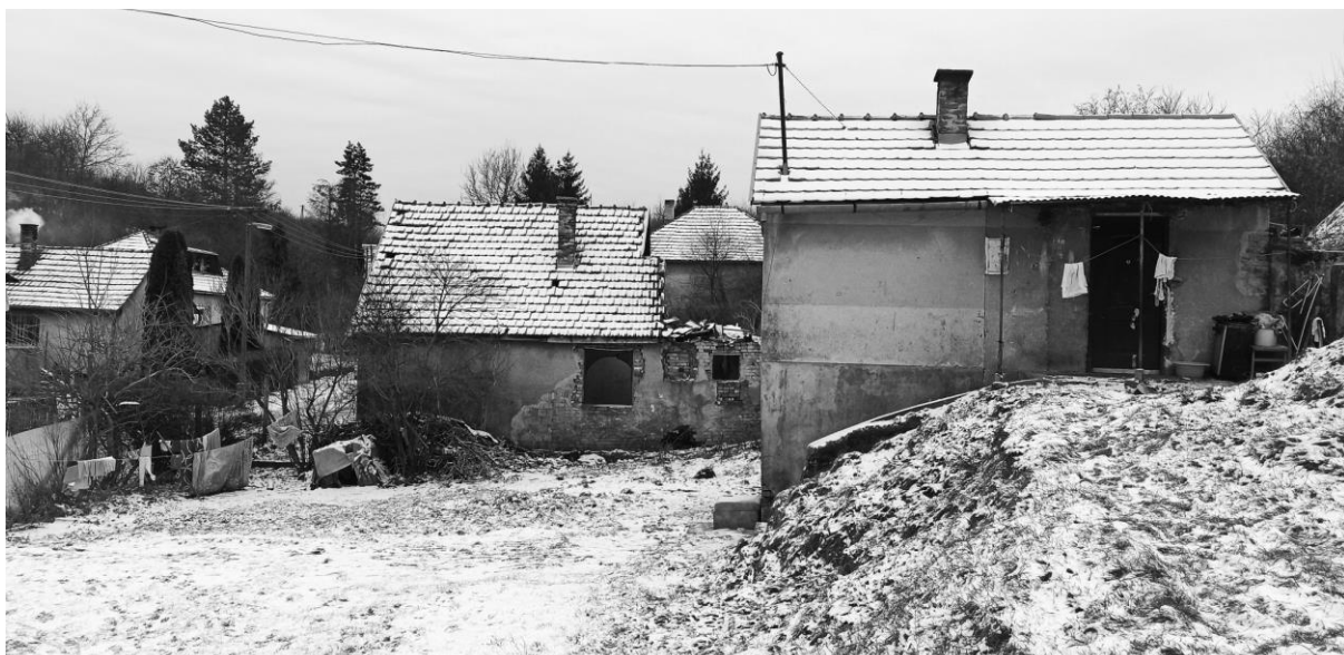
Barack utcai lakóházak. A jobb oldali ház jelenlegi lakói: 3 fő. Korábbi ház lakóinak száma: 10 fő.