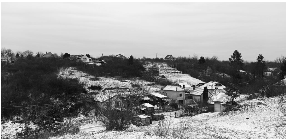
Barack utca lát képe a Körte utca felől induló ösvényről.