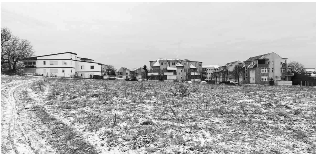
A jóléti társadalom arca a szegregátum felől.